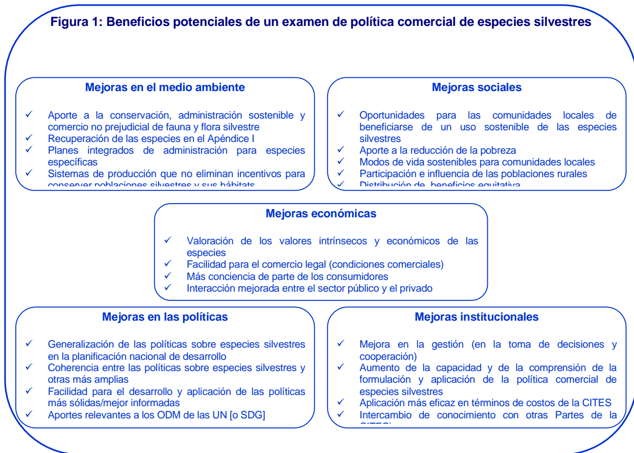
Figura 1: Beneficios potenciales de un examen de política comercial de especies silvestres

Los exámenes de las políticas ofrecen la oportunidad de explorar diversos aspectos de una política comercial de especies silvestres. En algunos casos, las Partes podrían contar únicamente con algunos de los elementos necesarios para generar una política comercial de especies silvestres eficaz u otras políticas podrían contradecirla. Este tipo de exámenes genera un contexto para que los países puedan mejorar la comprensión de la dinámica social, económica y ambiental, clave para el desarrollo de políticas coherentes, eficaces y equitativas. El gráfico a continuación detalla con mayor precisión los beneficios potenciales de los exámenes de las políticas comerciales de especies silvestres.