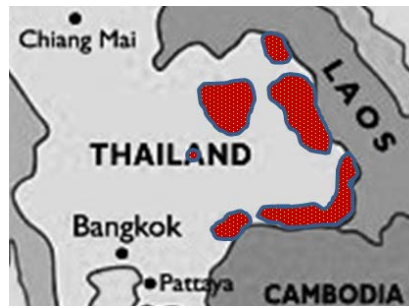
Mapa 2: Distribución actual de Dalbergia cochinchinensis en Tailandia