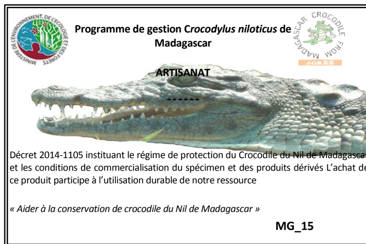
Figura 3. Etiqueta de producto para los productos de cuero de cocodrilo acabados producidos por fabricantes artesanales.

Los productos deben marcarse con una etiqueta proporcionada por la DGF (ej. véase Secretaría de la CITES 2013 y Fig. 3). La etiqueta de papel actual se ha puesto a prueba en los últimos dos años, existen problemas y se están examinando nuevas opciones (ej. Etiquetas de plástico, grabados en relieve, etc.). El uso de marcas/etiquetas para los productos muy pequeños (ej. dientes) es problemático, y por ahora están exentos de los requisitos de marcación. Sin embargo, los productos pequeños aún deben cumplir con los límites de tamaño de piel/cocodrilo.