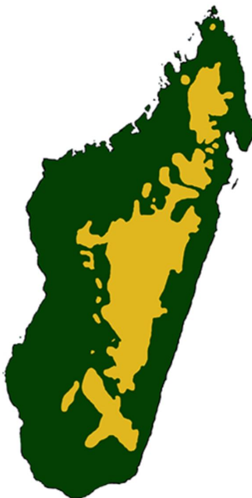
Figura 1. El núcleo de la distribución (sombra verde) de C. niloticus en Madagascar, de 0 a 1000 m snm. Los cocodrilos también se encuentran más hacia el interior, a 1000-1500 snm, y solamente están ausentes en las altitudes más altas (>1500 m snm).

En Madagascar, C. niloticus está ampliamente distribuido a lo largo del país (Fig. 1), pero abunda sobre todo en los sistemas de ríos y lagos que bordean los lados al noroeste y oeste del altiplano, y y en el noreste del país (por ejemplo, en los ríos de Maningoza, Sambao, Marotrandro, Bemarivo, Hafay, Ampandranana y Maningozamaty; en los lagos Marovoaikely, Marovoaibe, Ankiliholiho, Befandraria, Ampanihy, Sotria, Ankiliolio, Sahapy y Ampandra). Durante la estación húmeda, es posible que los cocodrilos sigan pantanos y pueden encontrarse en ríos/hábitats estacionales (por ejemplo, los ríos Begogo, Antsorobalala, Betsotaky, Amborometroka, Mokarana, Betombotomboky, Manarihena, Mangotroka, Anjanambo; ROM 1997). A pesar de que los drenajes de los ríos no estén directamente conectados, se considera que la distribución de C. niloticus es continua y no fragmentada.