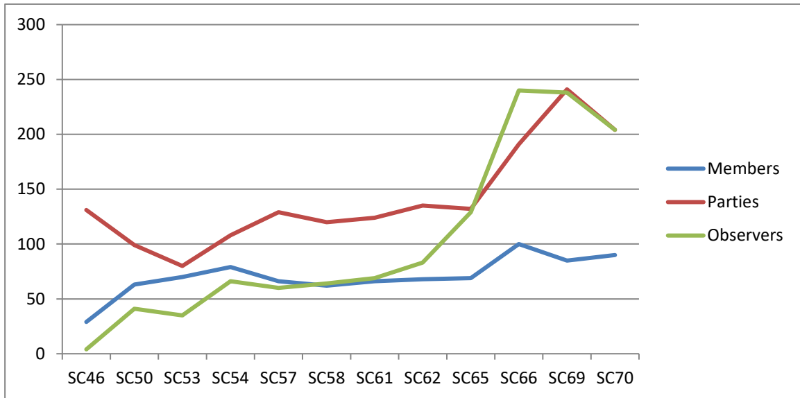
Gráfico 1. Participación en las reuniones del Comité Permanente, por categoría y en total